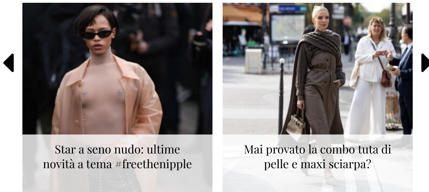
Star a seno nudo: ultime novità a tema #freethenipple