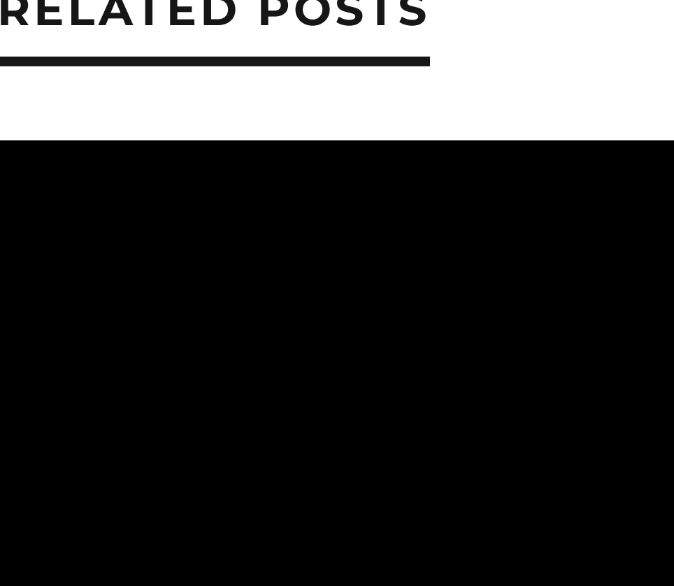
I GESTI DELL'ARTE